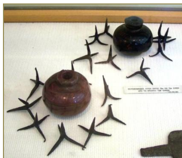
Δοχεία εκτόξευσης υγρού πυρός