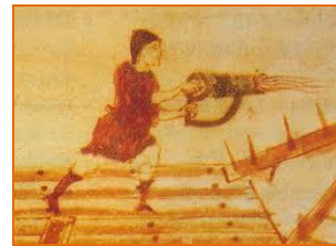
Εκτόξευση υγρού πυρός